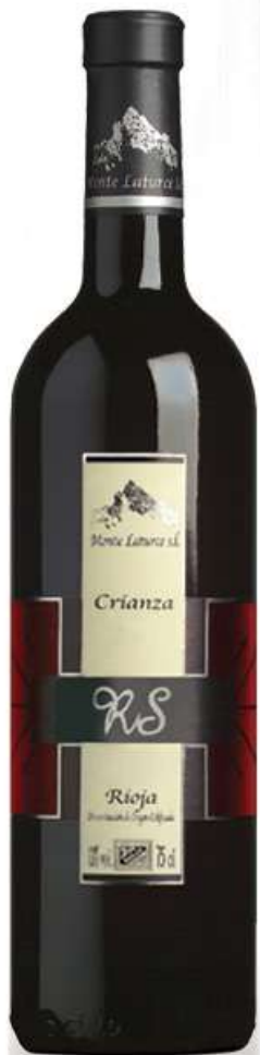
RS CRIANZA • vino tinto Denominación de Origen Calificada Rioja